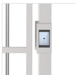
Lector código de barras y QR