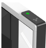
Lector de Tarjetas