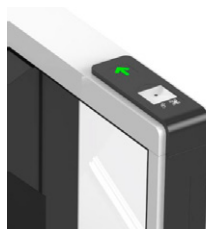
Lector Códigos QR