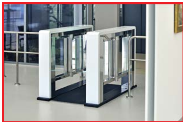
EG-BV Pasillo con hojas de cristal.